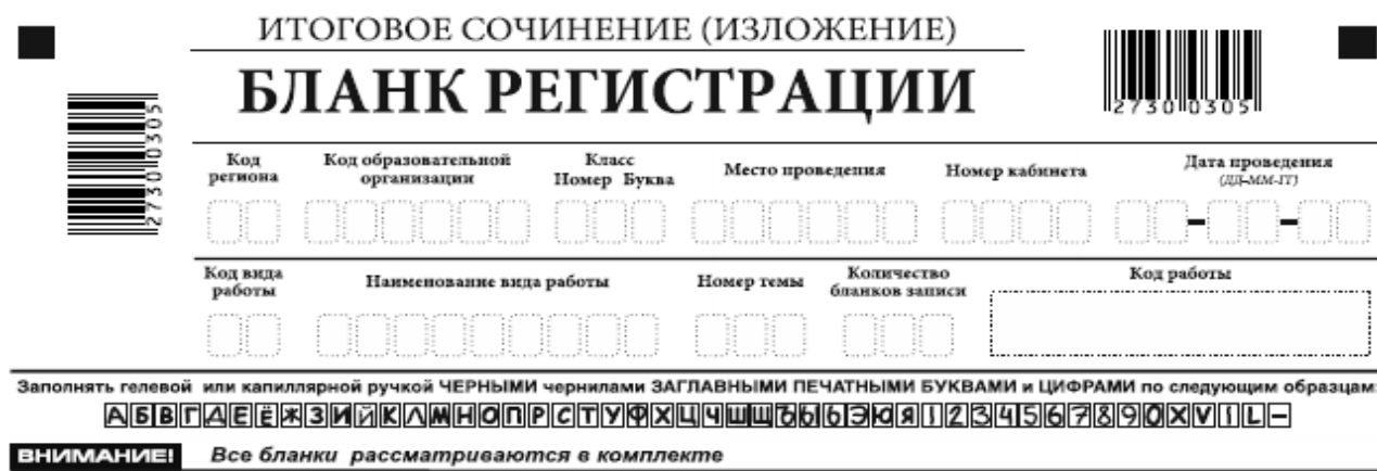
Рис. 2. Верхняя часть бланка регистрации

Поле «Код работы» формируется автоматизированно при печати бланков.