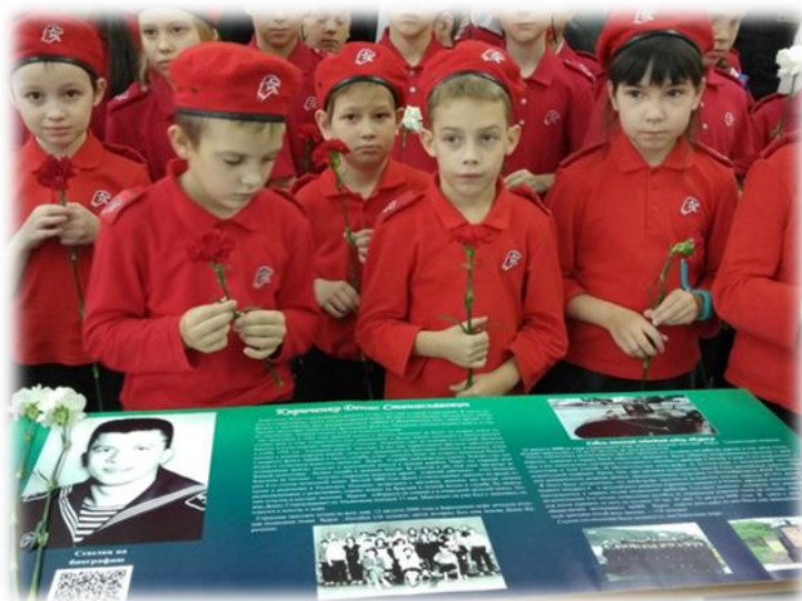
Открытие парты героя