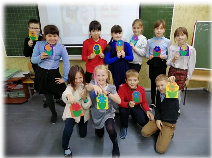
Изготовление подарков-открыток ко Дню бабушек и дедушек России