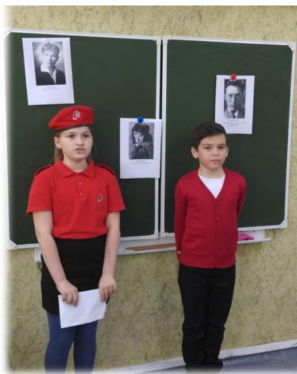
Рассказы о жизни и подвигах мурманских поэтов времен Великой Отечественной войны