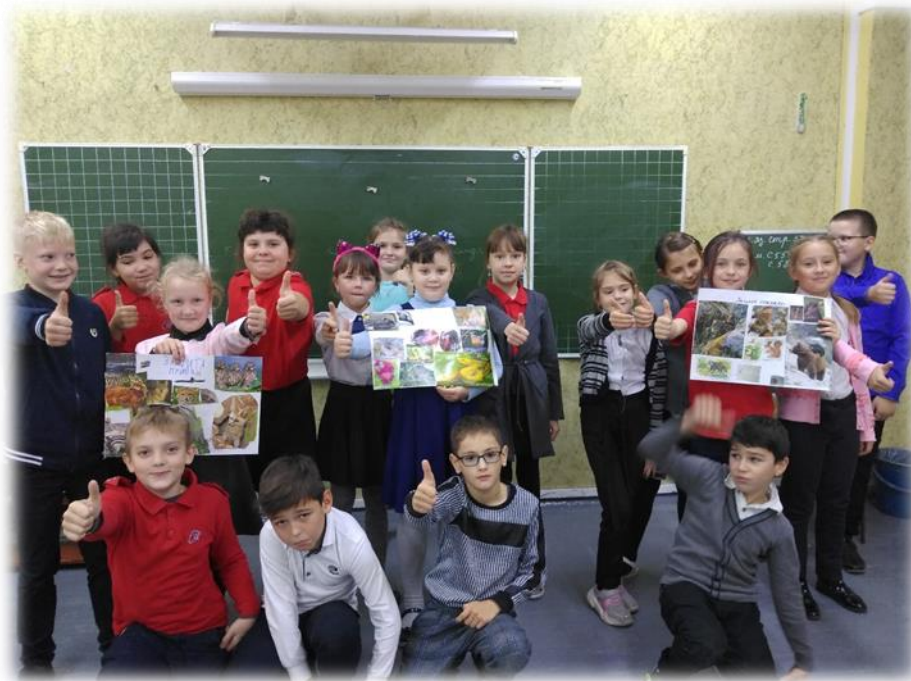
Мероприятие, посвящённое Всероссийскому дню охраны мест обитания флоры и фауны