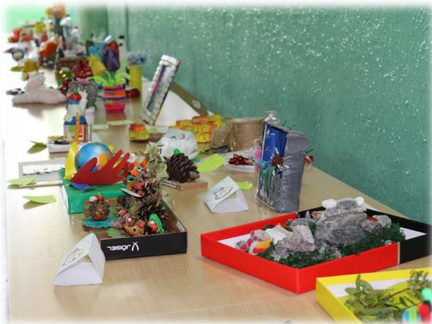
В рамках экологической недели выставка работ «Вторая жизнь ненужных вещей»