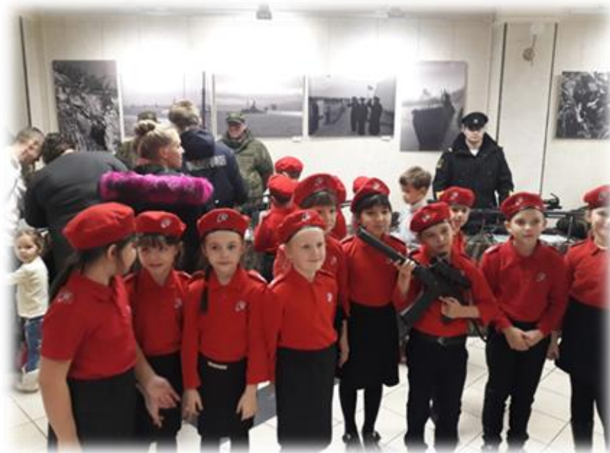
Экскурсия на выставку современного вооружения РФ