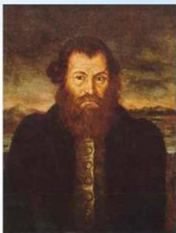
Мирон Ефимович (1803-1849)

По общей протяженности железных дорог лидирует США. Страна вдоль и поперек опоясана железнодорожными полотнами общей длиной, близкой к 300 тыс. км.