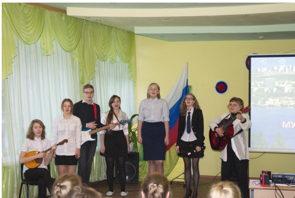
Выступление учащихся объединения авторской песни «Реут»