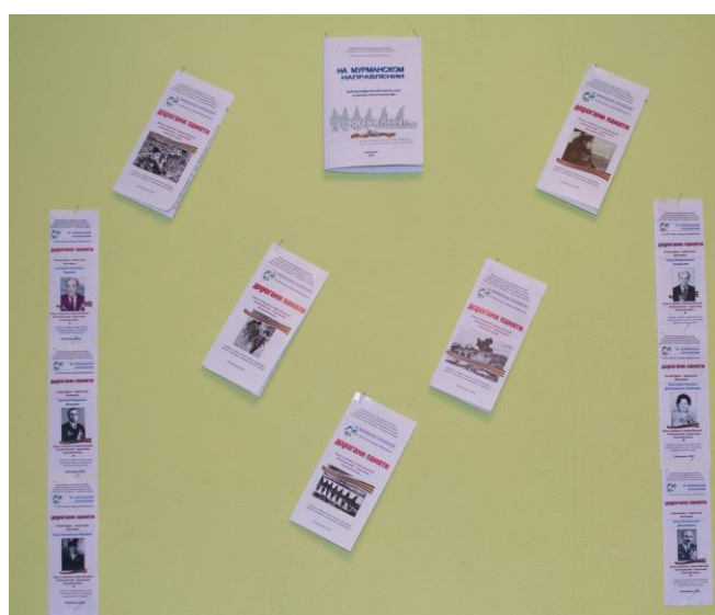
Буклеты «На Мурманском направлении»