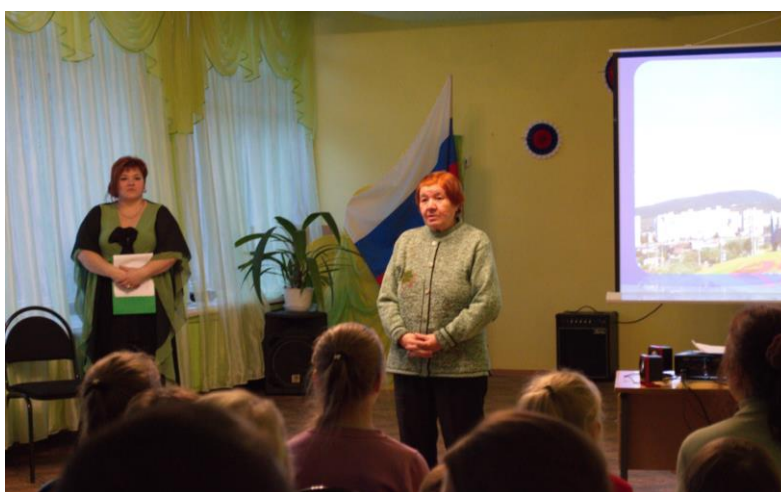
Выступление представителя Оленегорского отделения общероссийской общественной организации «Дети войны»